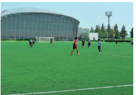
導入対象施設の一つ馬入サッカー場