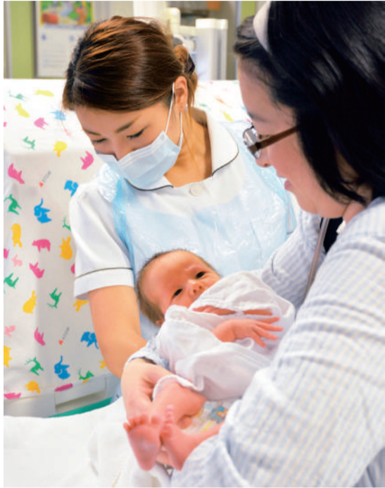
NICUで赤ちゃんの体重を計るお母さん

「相談相手が女性で良かった、と言われる機会が多いですし、女性医師を指名して来院される方もいます。手術などで対応できないときもありますが、時間をいただければ可能な限り、応じるようにしています」と心強い一言。「初めての受診は不安があると思いますが、どの医師も優しいの